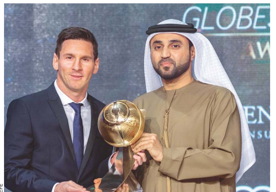
LIONEL MESSI DEL FC BARCELONA RECIBE EL PREMIO COMO "MEJOR JUGADOR DEL AÑO" EN DUBAI.

De esta manera, Messi llega como el gran favorito a quedarse con el Balón de Oro, el galardón que entrega la FIFA al mejor futbolista de 2015. La entrega será el próximo 11 de enero en Zurich, Suiza, y allí el argentino, que irá por su quinto trofeo, competirá en la terna con Cristiano Ronaldo y el brasileño Neymar.