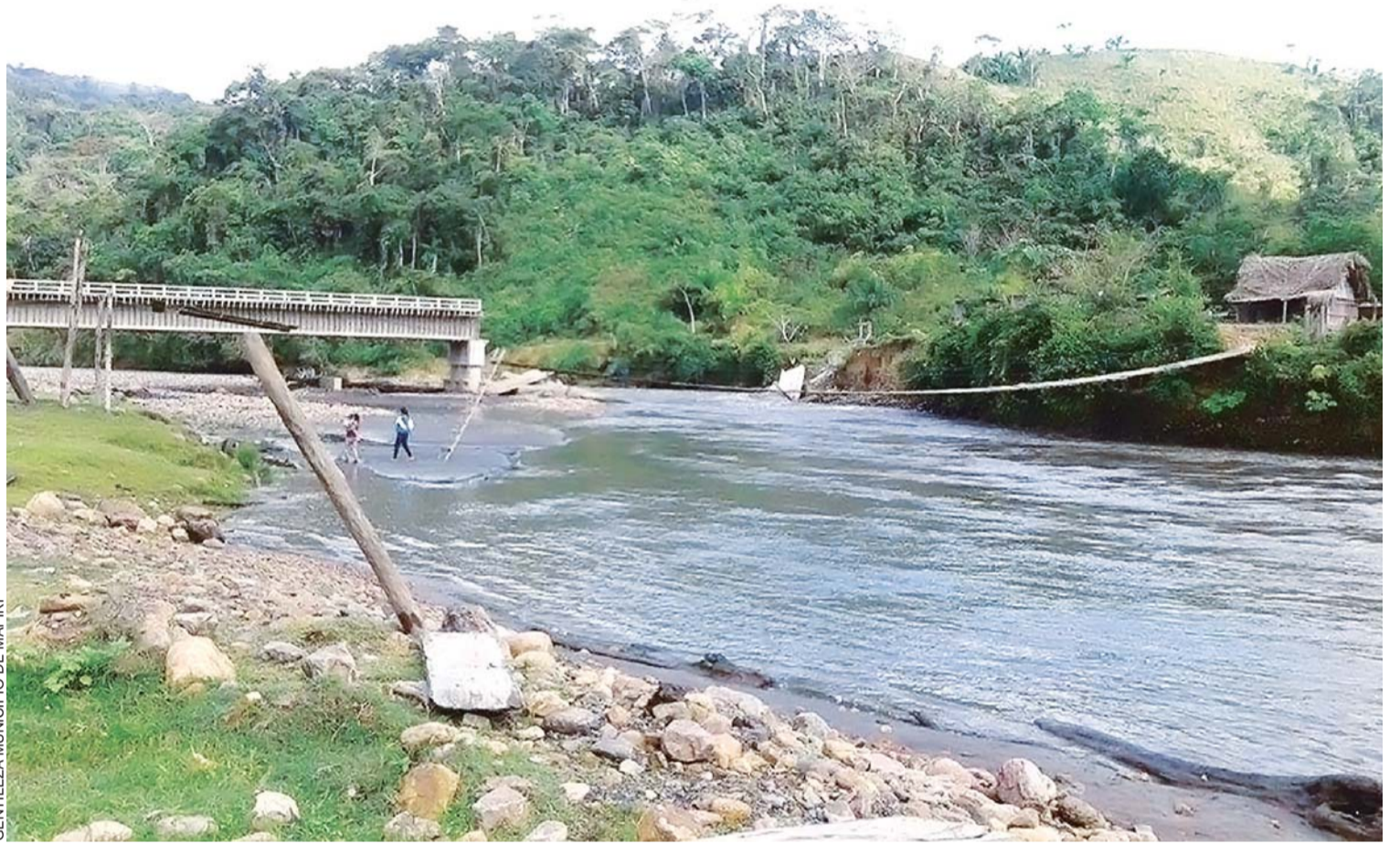
EL PRINCIPAL PUENTE DEL MUNICIPIO FUE DESTRUIDO POR EL CAUDAL DE AGUA REGISTRADO EN EL RÍO TARAPO.